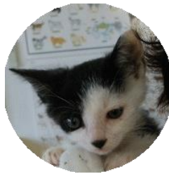
チャップ (改名川ツク)