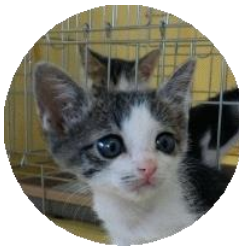
アンジエラ (改名アン)