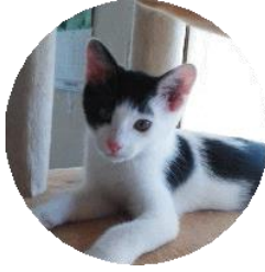
のぞみ (改名プリン)