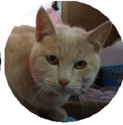
チャイ(改名チャトラ)