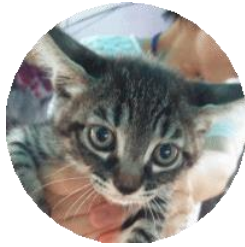
べっぴん (改名フジ)