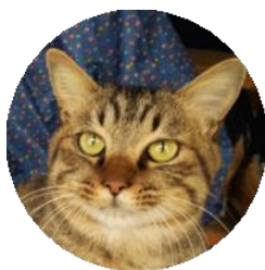
にゃん(改名 虎太郎)