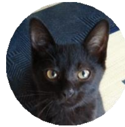
そうた (改名ヒョン)