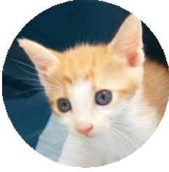
ひとみ (改名ニコル)