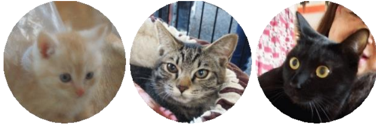
リオ(改名レオ) ジェカ(改名美琴) くら太(改名ジジ)